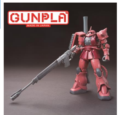
HG 1/144 MS-06S シャア専用ザクII