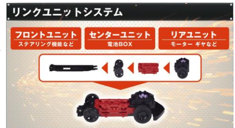
3つのユニットでシャーシを形成

マシンはフロント、センター、リアと3つのユニットで形成され、モーター、タイヤ、ギヤなどの多種多様なカスタムパーツのセッティングを走行するコースに合わせ、スピーディーかつ手軽に楽しむことができます。