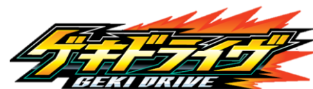
『ゲキドライブ』ロゴ

本商品は、白熱したレースシーンと、カスタム(パーツ組み替え)のしやすさを追求した新しいタイプのリアルレーシングホビーです。マシンは、『リンクユニットシステム』と呼ばれる、フロント、センター、リアからなる3つのユニットで形成されており、コースに合わせたスピーディーなカスタムが可能です。