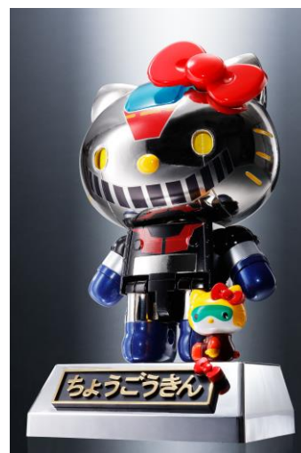
『超合金 ハローキティ(マジンガーZ カラー)』 8,424円・税8%込/7,800円・税抜 2016年5月下旬発売