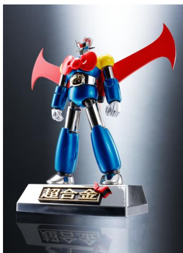
『超合金 マジンガーZ(ハローキティカラー)』 8,424円・税8%込/7,800円・税抜 2016年6月下旬発売

また、『超合金 ハローキティ(マジンガーZ カラー)』と『超合金 マジンガーZ(ハローキティカラー)』が活躍するショートアニメを、スペシャルサイト( http://tamashii.jp/special/sanrio/ )にて、2016年1月6日(水)より公開します。