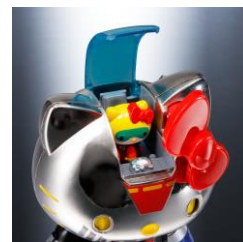
兜甲児カラーの ハローキティ・ミニフィギュア