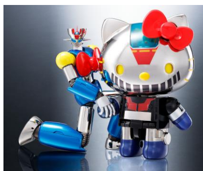
『超合金 マジンガーZ(ハローキティカラー)』 『超合金 ハローキティ(マジンガーZ カラー)』 集合画像