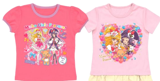
魔法つかいプリキュア！ A(ビビットピンク)、B(ピンク)

各 1,944 円・税 8%込/各 1,800 円・税抜、2016年2月21日(日)より順次発売