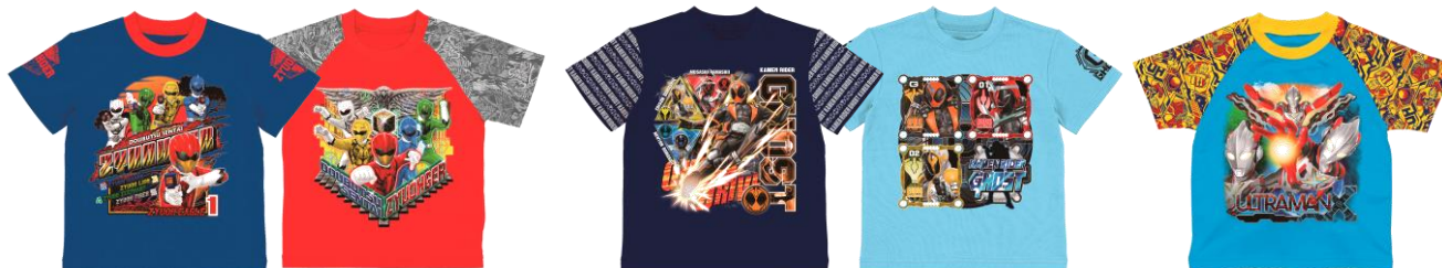
動物戦隊ジュウオウジャー A(ブルー)、B(レッド)