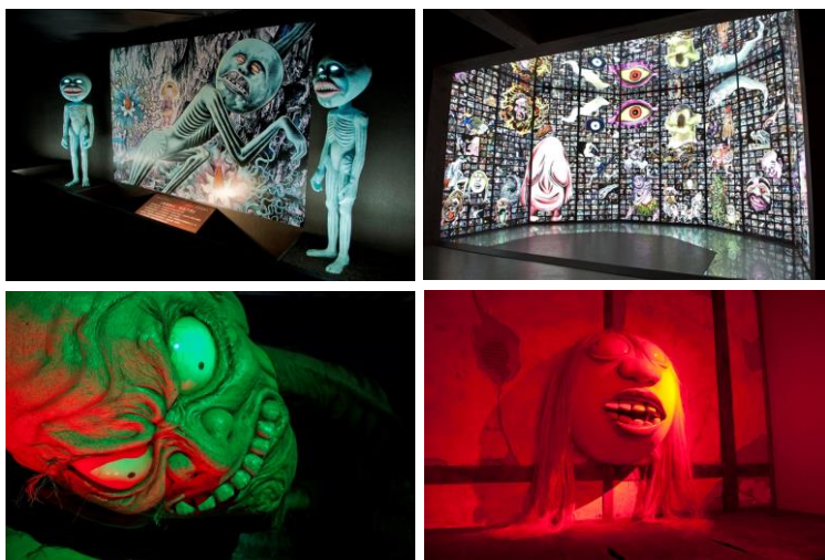
画像左:『体感妖怪アドベンチャー GeGeGe 水木しげるの大妖界』キービジュアル 右:展示物(例)

本イベントは2012年に台湾、2013年には大阪で開催されており、合計約58万人もの来場者を記録しています。そしていよいよ今年、関東の妖怪ファン、水木ファンが待ちわびた東京で開催します。本会場では、多くの人に惜しまれつつ、2015年11月に93歳でこの世を去った水木しげる氏のプロフィールと偉業を紹介する追悼コーナーも新たに設けました。