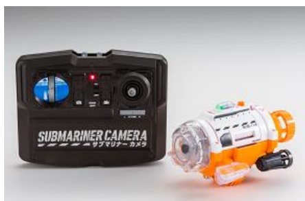
コントローラー・本体

その他、デジプロ付潜航浮上レバーで細やかな調整や、W スクリューによりその場で方向転換が可能で、狭い場所でも自由自在に航行できます。また、付属の「エサ入れアーム」にエサを入れて魚を呼び寄せ、間近でお気に入りの金魚などの撮影ができるユニークな仕掛けもあります。カメラの両脇にはヘッドライトが付いており、暗い場所を照らすことができ、水槽の他に浴槽や家庭用プール(水温は50℃以下)などでも遊べます。