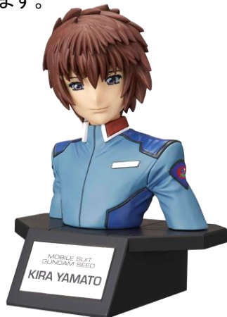
『フィギュアライズバスト』 「キラ・ヤマト」

今後も、「三日月・オーガス」(「機動戦士ガンダム 鉄血のオルフェンズ」の主人公)を2016年8月に、「刹那・F・セイエイ」(「機動戦士ガンダム 00」の主人公)を2016年9月に発売するなど、さまざまなキャラクターでシリーズ展開していきます。