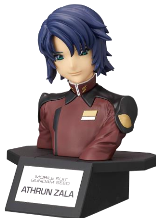
『フィギュアライズバスト』 「アスラン・ザラ」