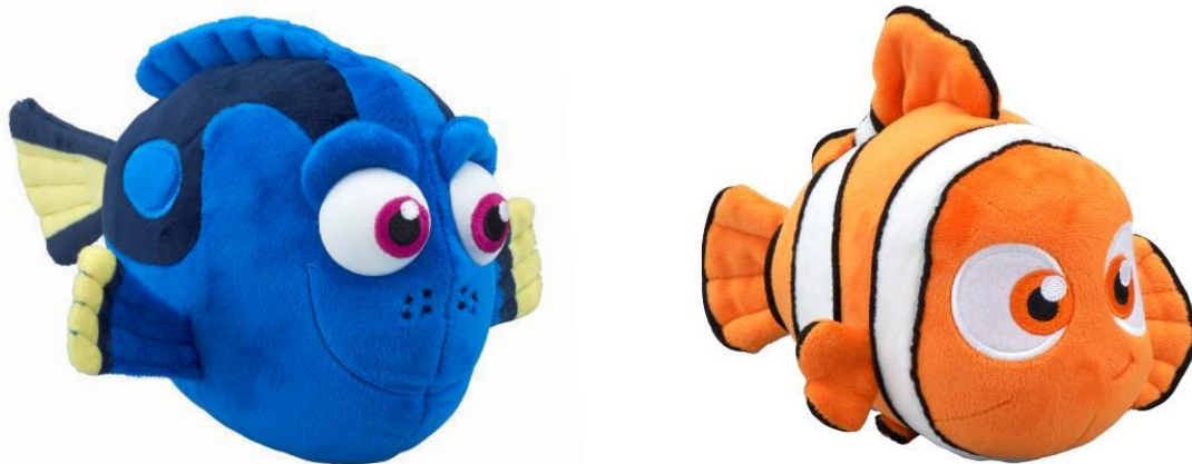
『おしゃべりぬいぐるみ ドリー』、『おしゃべりぬいぐるみ ニモ』 各 4,298円・税8%込/各 3,980円・税抜、2016年6月25日(土)発売

国内で発売する玩具のメインアイテムとして、主人公・ドリーがおしゃべりをしたり、歌を歌ったりするぬいぐるみ『おしゃべりぬいぐるみ ドリー』(4,298円・税8%込/3,980円・税抜)を、6月25日(土)に発売します。本商品は、全長約26cmのドリーのぬいぐるみで、話しかけると「ハーイ！あたしドリー」や「あなたニモ？」などのおしゃべりをしたり、ゆらすなどの振動を加えると「泳ぎましょう さあ♪泳ぎましょう さあ♪」と歌ったりします。また、しばらく話しかけなかったり、振動を加えなかったりすると「ふわあ～あ」とあくびをして眠り始めます。本商品の他に、「やあ！ぼくはニモ」などのおしゃべりをする『おしゃべりぬいぐるみ ニモ』(4,298円・税8%込/3,980円・税抜)も同時発売します。商品の主なターゲットは3歳～小学生で、全国の玩具店、百貨店、家電・量販店の玩具売り場、インターネット通販などで販売します。