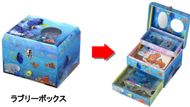
ラブリーボックス