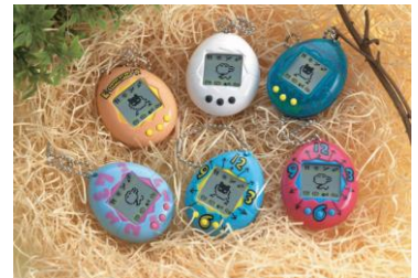
1996年 初代「たまごっち」