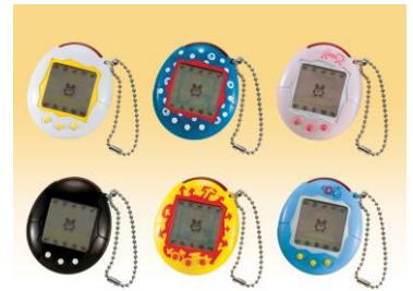
2004年「かえってきた!たまごっちプラス」 (赤外線通信が可能に)