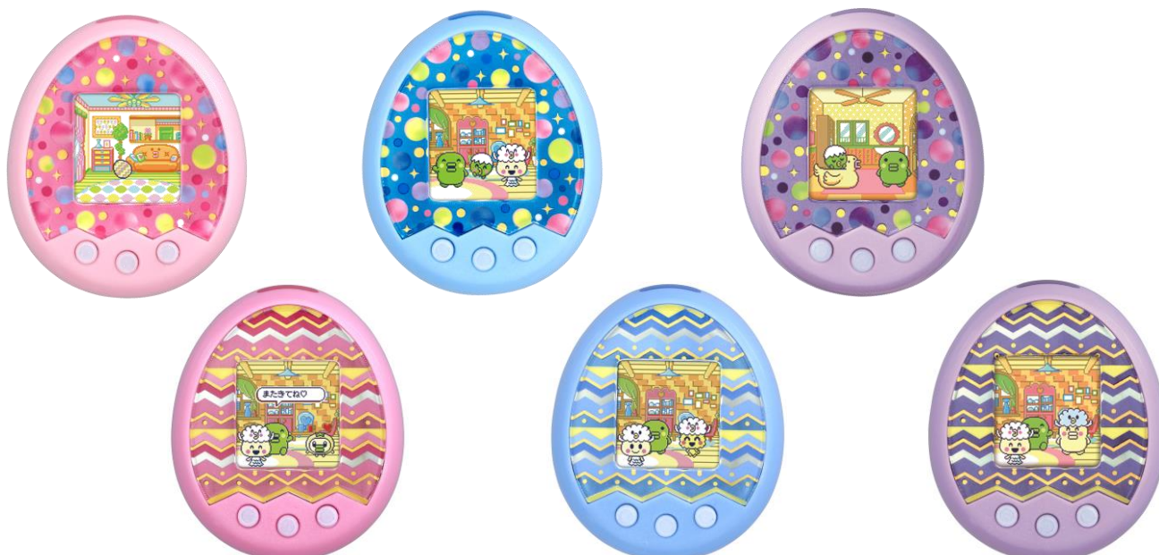
『Tamagotchi m!x』(全6種、オープン価格、2016年7月16日発売)