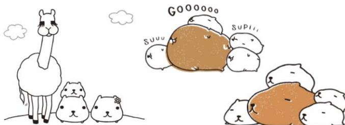
▲「線画ヴィンテージデザイン」