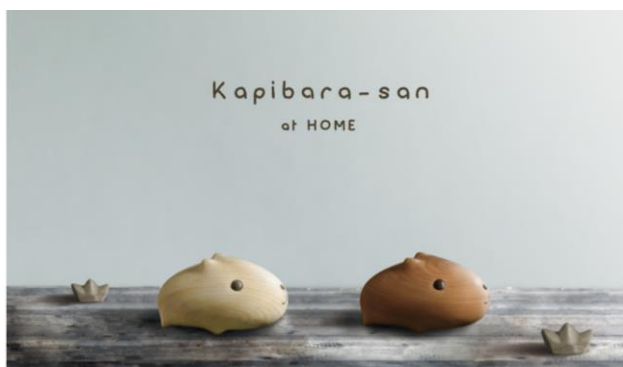
▲「ウッドテイストデザイン」

「カピバラさん」の「ナチュラル」「ほんわか」なイメージはそのままに、大人の女性が好む「おしゃれ」を新たに取り入れた、ハンドメイドのぬくもりあふれる木彫りの「ウッドテイストデザイン」、自然モチーフを刺繍で描いた「刺繍デザイン」、ナチュラルな手作り感をスタンプアートで演出する「スタンプデザイン」、原画を使用した大人っぽさの中にゆるさが残る「線画ヴィンテージデザイン」の4種のデザインを追加し、メインターゲットである20～30代の女性を中心に新規層拡大を図ります。