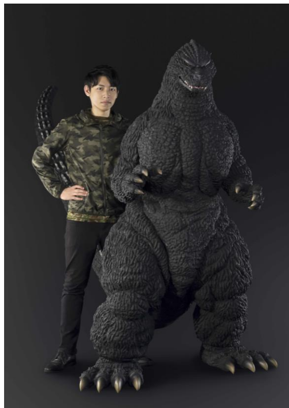
『Human Size ゴジラ(1991 北海道 ver.)』

イベント詳細: http://tamashii.jp/special/tamashii_nation/