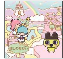
キキとララのふるさと 「ほしのせかい」