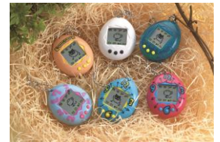
▲1996年 初代「たまごっち」

1996年11月23日に発売し、昨年同日に誕生20周年を迎えた携帯型育成ゲーム「たまごっち」は、1996年の発売から約2年半で全世界にて累計約4,000万個を販売する大ヒット商品となり、社会現象を巻き起こしました。2004年には、「かえってきた!たまごっちプラス」として復活。赤外線通信機能による通信遊びが小学生女子を中心に支持され、「たまごっちプラスシリーズ」以降、全世界で累計約4,100万個以上を販売し、1996年からこれまでに累計8,100万個以上を販売しています(2016年3月末現在)。