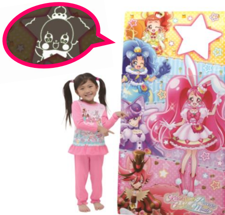
▲大きなピカピカキャラマット