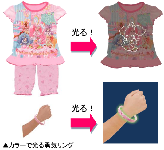
▲カラーで光る勇気リング

商品名 :『そでピカ! 光るパジャマ 仮面ライダーエグゼイド』 価格 :3,132 円・税 8%込/ 2,900 円・税抜 商品サイズ :100・110・120・130 cm 発売日 :2 月上旬 ©2016 石森プロ・テレビ朝日・ADK・東映