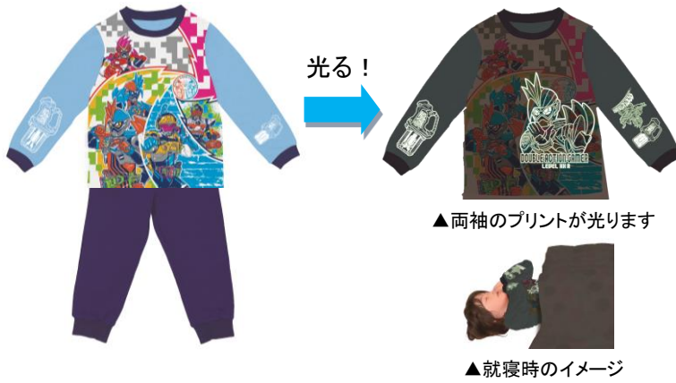
▲両袖のプリントが光ります