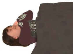
▲就寝時のイメージ