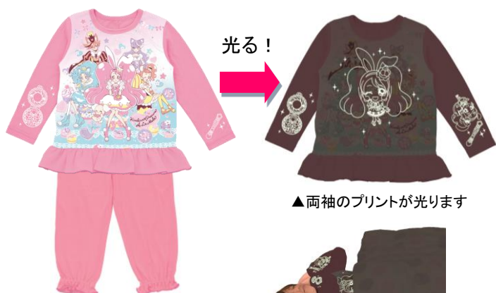
▲両袖のプリントが光ります