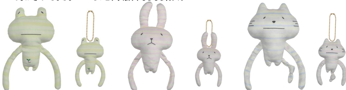
左:てながさんぬいぐるみ かえる(しましま) 右:てながさんマスコット かえる(しましま)