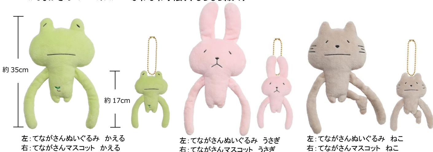
左:てながさんぬいぐるみ かえる 右:てながさんマスコット かえる