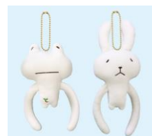
▲数量限定『てながさんマスコット』