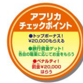
チェックポイント