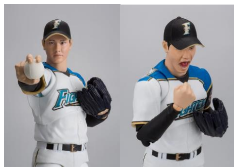
『S.H.Figuarts 大谷翔平』 〈左:投球シーン、中央:打撃シーン、右:表情(2種)〉 7,776円・税8%込/7,200円・税抜 2017年11月下旬発売