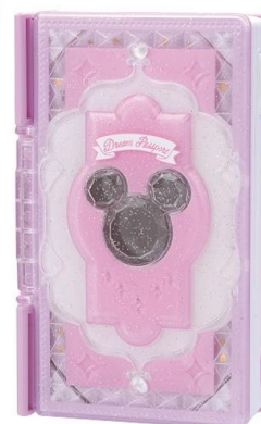
ドリーミーピンク