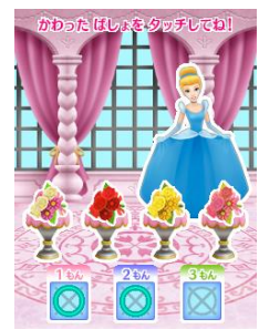
デコアートレッスン