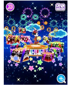
ドリームファンタジー②