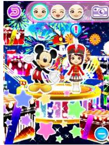
ドリームファンタジー①

自分だけの光のショー「ドリームファンタジー」を作ることができます。花火やキラキラ、音楽などの素材を配置するだけで簡単に作成でき、自分だけの光のショーを楽しむことができます。音楽は、エレクトリカルパレードを含む、計 3 曲あります。