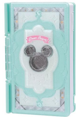
シャイニーミント

『ディズニー マジックキャッスル 魔法のタッチ手帳 ドリームパスポート』 (全2色、各10,778円・税8%込/各9,980円・税抜、2017年10月7日発売)