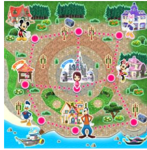
「キャッスルタウン」の全体マップ

プレイヤーのキャラクターデータ「マイキャラ」でマップをたどりながら冒険し、ディズニーのキャラクターと出会って話をしたり、記念撮影をしたり、シールを集めたりすることができます。始めは「キャッスルタウン」を冒険でき、ゲームを進めることで、行ける場所が増え、最終的には 7 つの世界にマップが広がり冒険を楽しむことができます。