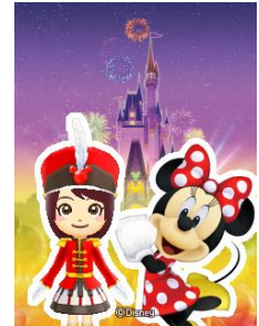
キャラクターと記念写真