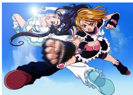
左:キュアホワイト 右:キュアブラック

運動神経抜群の美墨 みすみ なぎさ(キュアブラック)と頭脳明晰の雪城 ゆきしろ ほのか(キュアホワイト)は、同じ学校に通う中学2年生。ある日、ふたりは携帯電話のような「カードコミュニケーション」に入った不思議な生き物メップルとミップルに出会います。そんなふたりに悪の使者が突然襲い掛かり、メップルとミップルの言う通りに「カードコミュニケーション」にプリキュアカードをスラッシュすると、ふたりはプリキュアに変身します。趣味も性格も違うふたりが力を合わせて邪悪な敵に立ち向かうストーリーです。