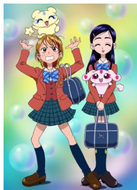
左:美墨なぎさ、メップル 右:雪城ほのか、ミップル