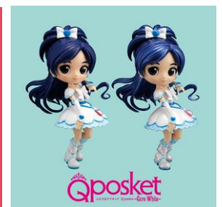
▲Q posket-Cure White-