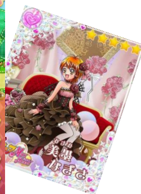
▲ボイス付カード(一例)