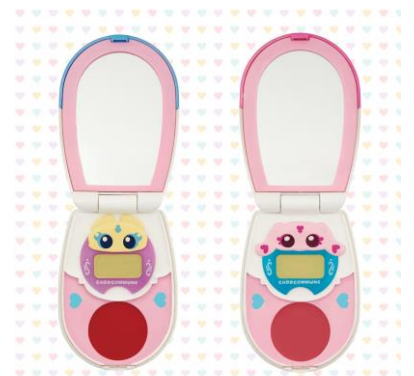
▲キュアブラック (チェリーピンク) ▲キュアホワイト (ピーチピンク)