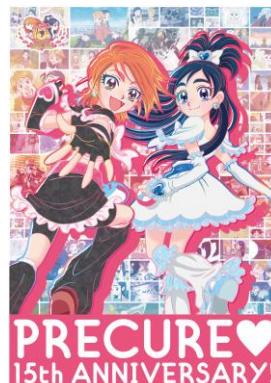
15周年記念ビジュアル

プリキュア 15周年公式サイト: http://www.precure-anniv.com/