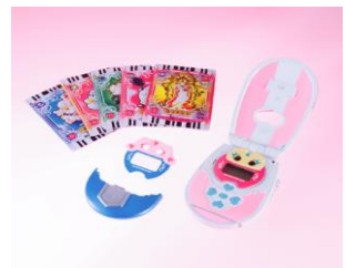
▲「カードコミュニケーション」 2004年2月発売

この度、2月1日が「ふたりはプリキュア」のアニメ放送がスタートした日ということから“プリキュアの日”と制定(日本記念日協会公認)されました。プリキュアをさらに多くの人に愛してもらい、その魅力を商品・サービスを通じて世の中に浸透させていきます。