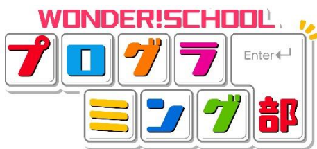
▲「ワンダースクール プログラミング部」ロゴ

バンダイが得意とするエンターテインメントを盛り込んだ、さまざまなプログラミングコンテンツを、子どもから大人まで楽しめる、プログラミングの学びと実践の場です。気軽に楽しめるゲームや動画で「プログラミング」に携わる機会を創出します。