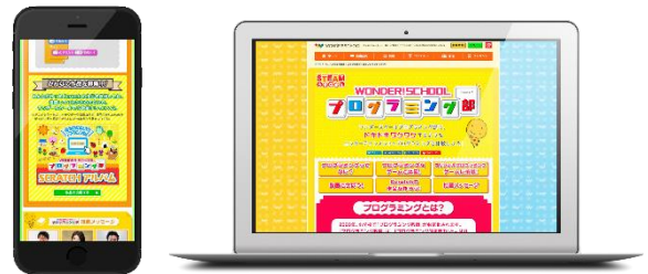
▲「ワンダースクール プログラミング部」画面イメージ ※実際の画像とは異なります