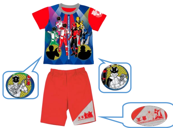
▲商品と温めた後のイメージ(吹出し内)

▲『カラチェンパジャマ 快盗戦隊ルパンレンジャーVS警察戦隊パトレンジャー』(2色展開:レッド・全グレー)