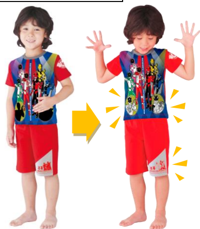
▲着用イメージ 左)温感インク部分を温める前 右)温めた後