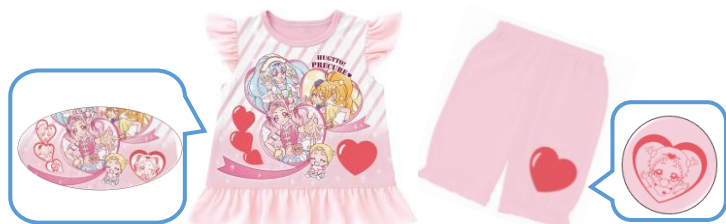
▲『カラチェンパジャマ HUGっと!プリキュア』 (2色展開:ピンク・サックス)

▲『カラチェンパジャマ 快盗戦隊ルパンレンジャーVS警察戦隊パトレンジャー』(2色展開:レッド・全グレー)