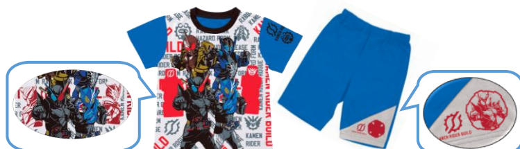
▲『カラチェンパジャマ 仮面ライダービルド』 (2色展開:ブルー・サックス)

(各3,132円・税8%込/各2,900円・税抜、2018年4月19日(木)より順次発売、サイズ:100～130cm)