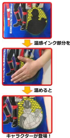
▲温感インク部分イメージ