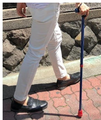
▲商品使用イメージ

福祉用具市場は日本国内で約1兆4,337億円規模(2015年度)とされています。軽度者の利用が多い「歩行補助杖」の2015年度市場は48億円で、2011年からの5年間で120%に拡大しています※1。