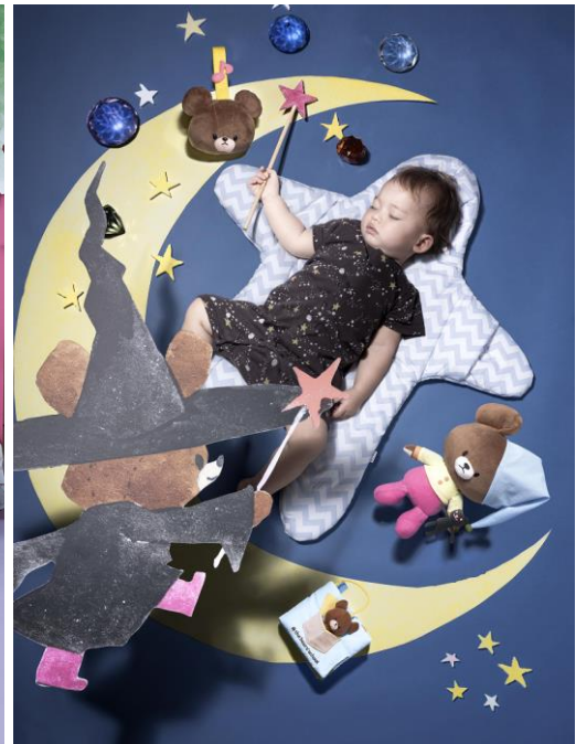
▲『the bears' school baby』ブランドイメージビジュアル

バンダイの独自アンケートにて生後0カ月～3歳の子どもを持つ中国人の母親380人に「ベビー玩具に期待すること」を調査したところ、約90%の人が「心・身体・頭の成長に良いこと」「安全・安心であること」を期待していると回答しました。本ブランドはアンケートの結果を商品企画に反映しながらも、中国で人気の高い動物「くま」をモチーフとしたIP※2「くまのがっこう」を起用することでさらなる価値を付加しています。中国のベビー玩具市場において、キャラクター商品の販売シェアは全体の約1.5%にとどまっています。本ブランドからキャラクターの魅力を発信し、市場のさらなる活性化を図ります。2020年3月までに本ブランドのシリーズ累計売上約15億円を目指し、以降もラインアップを拡大していく予定です。 ※1 出典:中国国家统计局 ※2 IP: Intellectual Property(キャラクターなどの知的財産)