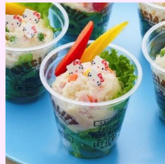
▲『キャラフル』トッピングイメージ

左から、ミッキーマウスのコブサラダ、リラックマのそばろ弁当、ハローキティのポテトサラダ