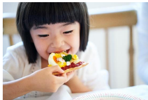
▲キャラフルを使った食事風景イメージ(ハローキティのピザ)