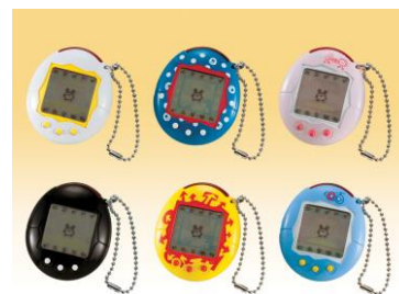
2004年『かえってきた！たまごっちプラス』 (赤外線通信が可能に)