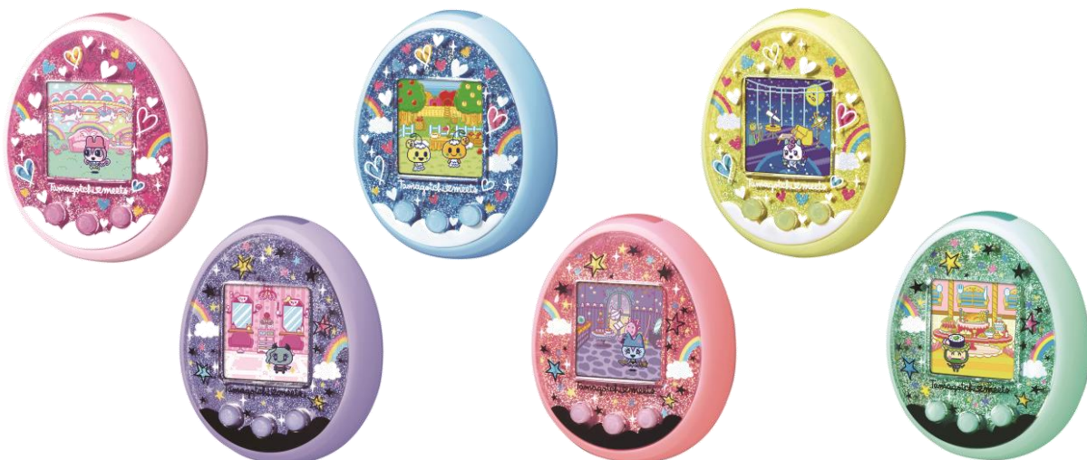
『たまごっちみーつ』

本商品は「メルヘンみーつ ver.」と「マジカルみーつ ver.」の2種類あり、本体のカラーリングやデザインのほか、プレイ中に登場する限定キャラクターが異なります。