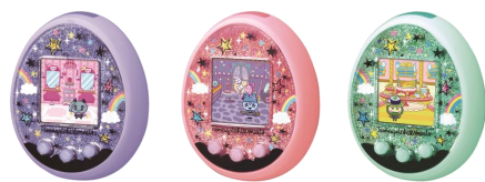
▲ マジカルみーつ ver.