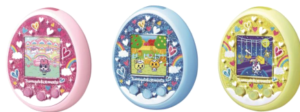
▲ メルヘンみーつ ver.