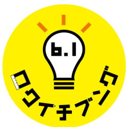
「ロクイチブンゴ」 ブランドロゴ

「ロクイチブンゴ」のラインアップは、はみ出さずに貼れる『線ふせん』、大事なメモをノートや資料の角に合わせて貼れる『かどふせん』、報告・連絡・相談を楽しく知らせる『ほうれんそうふせん』(それぞれ 432 円・税 8% 込/400 円・税抜)の新品 3 点に、過去の文房具アイデアコンテストから生まれた発売中の商品も「ロクイチブンゴ」として加え、11月中旬より全国の文具・雑貨店、量販店の文具売場などで順次展開します。