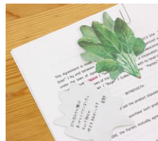
画像左から『線ふせん』、『かどふせん』、『ほうれんそうふせん』

(上段:商品パッケージ、下段:使用例、それぞれ 432 円・税 8%込/400 円・税抜、11月中旬より順次展開)