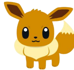
▲イーブイ (本商品オリジナルアート)

イーブイは、1996年発売のゲームソフト『ポケットモンスター赤・緑』以降のポケットモンスターシリーズに登場するポケモンで、不安定な遺伝子を持ち、さまざまな姿に進化する可能性を秘めた“しんかポケモン”です。2017年より、イーブイの魅力を伝える期間限定プロジェクト「プロジェクトイーブイ」も発足し、プロジェクト公式 Twitter のフォロワーは20万人を突破しています。