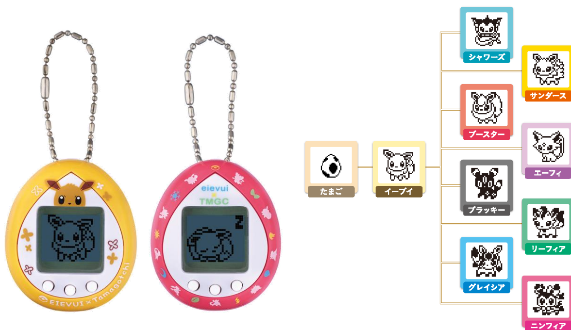
『イーブイ×たまごっち』

ごはんには“ポケモンフーズ”をあげたり、溜まった毛玉はブラッシングしてあげたりするなど、イーブイならではの世話遊びが楽しめます。たまごから生まれたイーブイはお世話の仕方や頻度などによって8タイプのすがたのポケモンに進化します。また、それ以外にも本商品オリジナルの姿になることもあります。たくさんお世話をして仲良くなるとイーブイのズームアップの表情を見られたり、反対にお世話をさぼっているとじけたくさを見せたりとイーブイの愛らしい表情が楽しめる演出も組み込まれています。