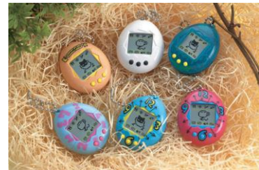
1996年発売「たまごっち」

携帯育成デジタルペット「たまごっち」は、1996年11月23日に発売しました。1996年の発売から約2年半で、全世界にて累計約4,000万個を販売し、社会現象となるほどのブームで大ヒット商品となりました。1996年からこれまでに累計8,200万個以上を販売しています(2018年3月末時点)。現在では玩具だけでなく、キャラクターとしての人気も定着しています。