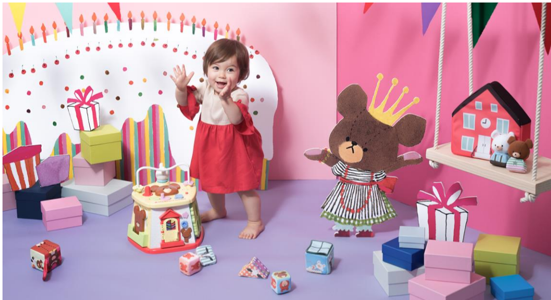
▲『the bears' school baby』ブランドイメージビジュアル

中国のマタニティ・ベビー用品市場規模は、2017年度に42.8兆円※1(前年度比116%)となり、日本の約11倍の規模です。バンダイは、その中で約4.6兆円を占めるベビー玩具市場に向け、中国でも展開されている日本発の絵本シリーズ「くまのがっこう」のキャラクターを起用し、ベビー玩具ブランド『the bears' school baby』を立ち上げます。これまで培ったキャラクター商品企画のノウハウと安全・安心を追求した独自の品質基準を生かし、中国の巨大マーケットに参入します。