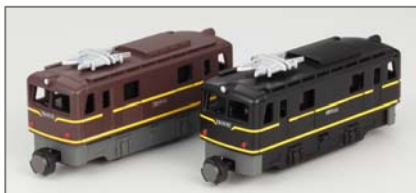
「直流電気機関車 EB10形」（2色・2両入り／1,260円・税込）

フリーランス車両「直流電気機関車 EB10形」を「Bトレ博」ほか各種イベントにて発売します。 ※本商品はイベント限定商品であり、店頭での発売はありません。