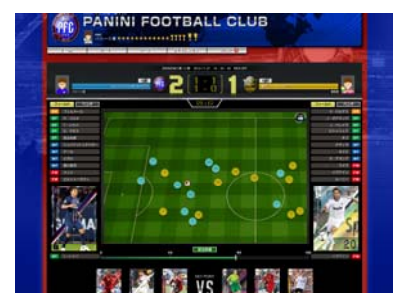
▲選手の動きを再現した試合展開

緻密なシミュレーションエンジンで選手の動きを忠実に再現した試合展開を、LIVEで確認することができます。公式データに基づいてプレイヤーの能力が設定されており、リアルな試合展開をお楽しみいただけます。