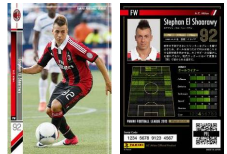
▲(左) カード表面 (右) カード裏面

第1弾は、世界の強豪クラブチーム16チームの中から全191種の強力なカードラインナップで展開します。世界最高クラスの選手カードが多数登場し、躍動感ある写真や公式プロフィールが詳細に記載されています。現実の試合データから算出したプレイスタイルや能力は、2012-2013シーズンの結果を最速で反映しており、コレクションする楽しみに加え、リアルなゲーム展開をお楽しみいただけます。