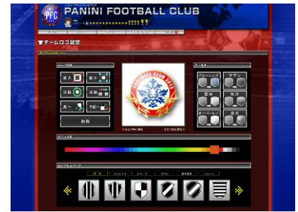
▲チームロゴ設定画面

参加者募集中のリーグから好きなリーグを選んで参加したり、自分自身がオーナーになってリーグを作成できます。試合は自動で進行するため気軽に参加でき、日本中のライバルたちとの試合をお楽しみいただけます。