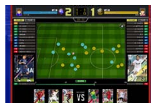
「パニーニフットボールリーグ 01[PFL01]」（カード3枚1セット：315円・税込）