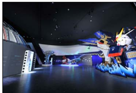
「ガンダムフロント東京」 内観