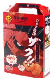
「シャア専用赤いポテトチップス」 900 円