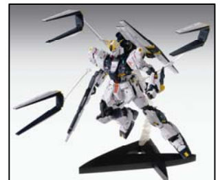
「MG \nu ガンダム Ver.GFT」7,000 円