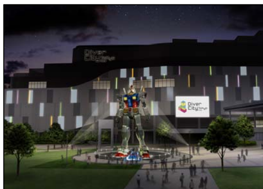
LED ライトアップイメージ

7月20日(土)から9月1日(日)まで、ダイバーシティ東京 プラザのフェスティバル広場に立つ、全高18m実物大ガンダム立像を間近で見ることができる夏季限定イベント「ウォークスルー」を開催いたします。「ウォークスルー」では、ガンダム立像が立つ両足の間を来場者の皆様によって歩き、通常見ることのできない角度で、ガンダム立像を見る事ができます。期間中はステージが設置され、普段とは違う特別感を演出。また、足の周りにはLEDライトが設置され、夜間のみ体感できる躍動感も、是非ご堪能下さい。