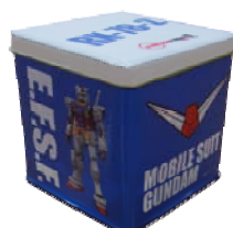
「プリントクッキー四角缶」 1,000 円