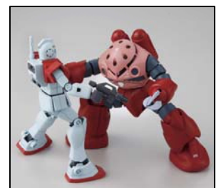
「HGUC シャア専用ズゴック VS ジム Ver.GFT」 1,500 円