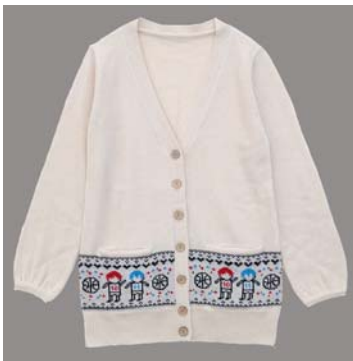
ジャガードスクールカーディガン 黒子・火神 ver. (5,995円・税込)

デフォルメしたキャラクターや、人気キャラクターの背番号など、作品をイメージさせるモチーフやシルエットなどをさりげなくデザインすることで、レディース市場へのスムーズなキャラクターアパレルの展開を行います。