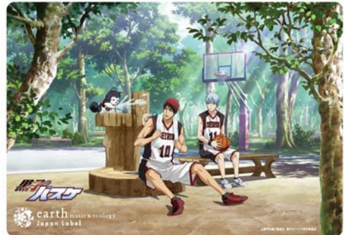
店頭・ECサイトで限定公開される 本企画のために描き下ろされたイメージイラスト

9月14日(土)から「earth music&ecology」池袋サンシャインシティ店にて先行販売を開始。9月28日(土)からは、全国の「earth music&ecology」全店舗にて販売を開始します。