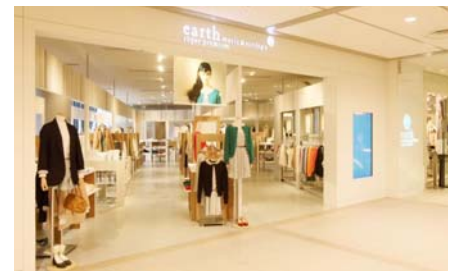
全国に200店舗以上を展開し10代・20代女性の幅広い 支持を受ける「earth music&ecology」店舗写真

デフォルメしたキャラクターや、人気キャラクターの背番号など、作品をイメージさせるモチーフやシルエットなどをさりげなくデザインすることで、レディース市場へのスムーズなキャラクターアパレルの展開を行います。