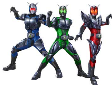
△オリジナルの仮面ライダー作成例

※稼働に合わせてガンバライダーカードの店頭配布キャンペーンも実施予定です。詳しくは公式HPで情報を公開していきます。