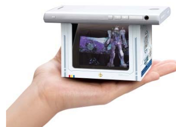
※パッケージは仮のものです。

第2弾の『ハコビジョン MOBILE SUIT GUNDAM』は、大人気アニメ「機動戦士ガンダム」のオリジナル映像をフィギュアに重ね合わせ疑似的に3Dプロジェクションマッピングを再現し、「スマートフォン」×「フィギュア」×「ガンダム」が織りなす驚愕の映像体験をお楽しみいただけます。