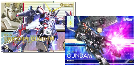
【ガンダムデュエルカンパニー01 カード】