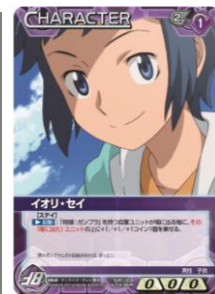
【ガンダムウォーネグザ 第6弾 EX ブースター『雷光の進撃』カード】 【ガンダムビルドファイターズ ANIME EDITION パッケージとカード】

※プレスリリースの内容は2014年7月17日現在のものであり、予告なく変更する場合があります。 ※プレスリリースに掲載の商品画像は開発段階のものであり、実際の商品とは異なる場合があります。 ※プレスリリースに掲載している価格は全て税8%込です。