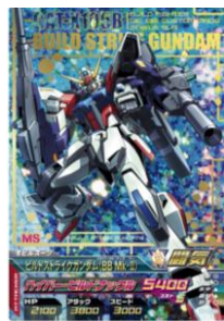
【ガンダムトライエイジ カード】