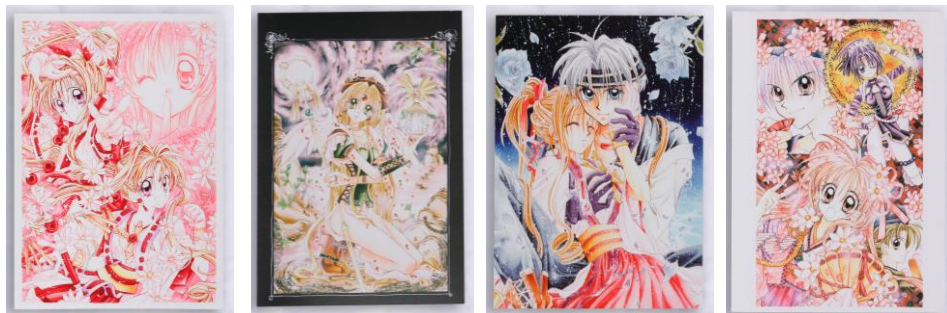
当時の思い出がよみがえる 美麗原作イラストシート(約148mm×105mm)が4種付属