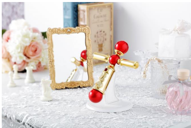
『PROPLICA 神風怪盗ジャンヌ ロザリオセット』 (左:「神風怪盗ジャンヌ」20周年ロゴ、右:本商品) 12,960円・税8%込/12,000円・税抜、2018年11月発売予定