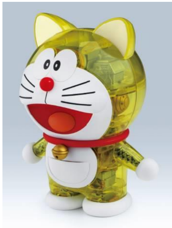
『Figure-rise Mechanics 元祖ドラえもん』 左:元祖ドラえもん、右:元祖ドラえもん(クリアボディ) 2,700円(税8%込)、2018年9月1日(土)発売