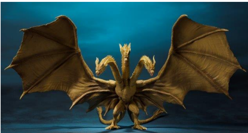
『S.H.MonsterArts キングギドラ(2019)』 18,360円・税8%込/17,000円・税抜 2019年6月発売予定 2019年1月9日(水)予約受付開始