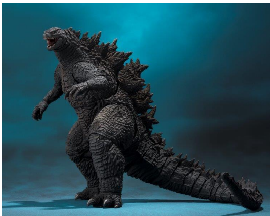
『S.H.MonsterArts ゴジラ(2019)』 7,020円・税8%込/6,500円・税抜 2019年5月発売予定 2019年1月9日(水)予約受付開始