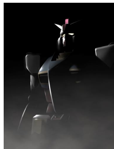
ガンダム 40 周年記念 KEN OKUYAMA DESIGN ガンブラプロジェクトスペシャルムービー ティザービジュアル

本映像に登場するガンダムは、工業デザイナーの奥山清行氏が率いる KEN OKUYAMA DESIGN がデザイン、そして、映像楽曲を株式会社 LDH JAPAN が提供するコラボレーションムービーです。この企画は、世界で活躍するケンオクヤマ氏が本気でプロダクトとしてガンダムを検証しデザインしたらどうなるのかを映像とガンブラの両面からアプローチする特別企画です。また、商品化にあたり、映像とリンクしたアクション表現などを再現できるガンブラを目指して鋭意開発中(発売時期、価格未定)です。