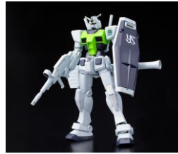
スワローズ バージョン