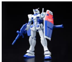
ドラゴンズ バージョン