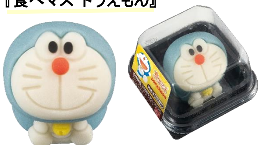
▲断面(カスタード餡入り)