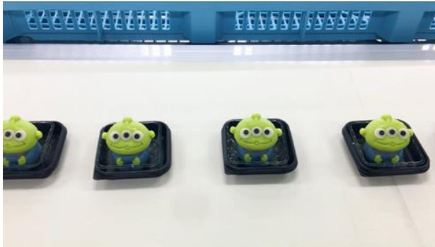
▲工場のラインに乗ってきた製品は、一つ一つ丁寧に仕上げています。

小さなパーツや細かな部分まで、一つ一つ職人の手作業で仕上げています。手作業ならではの繊細な細工で、ミリ単位で印象が変わるキャラクターの再現性を高めています。