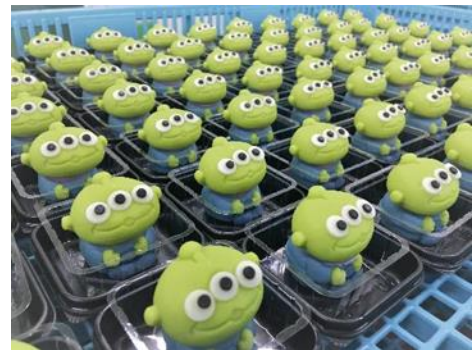
▲出来上がった製品。