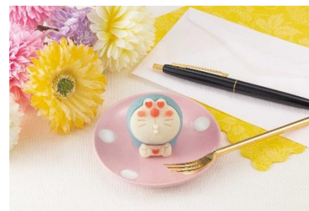
▲『食べマス ドラえもん ハート ver.』イメージ