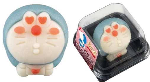
▲断面(いちご餡入り)