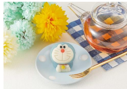
▲『食べマス ドラえもん』イメージ