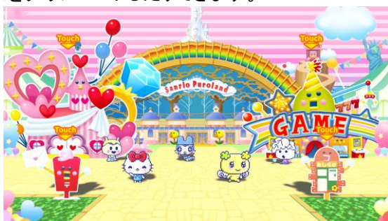
▲広場でサンリオキャラクターに会える！

Bluetooth®を通じて『たまごっちみーつ』とも一緒に遊ぶことができるコミュニケーションアプリ「たまごっちみーつ アプリ」内でも、期間限定でたまごっちが集まる広場にサンリオキャラクターが登場したり、限定のコラボアイテムをダウンロードしたりできます。