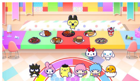
▲ミニゲーム「にじいろレストラン」