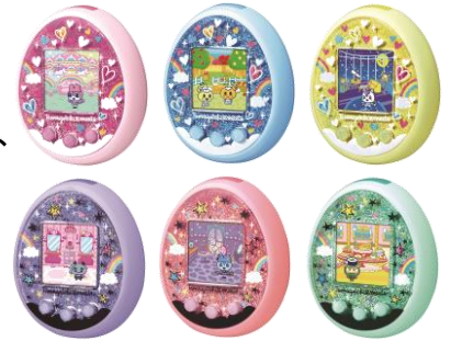
『たまごっちみーつ』 全2種×各3色、オープン価格、発売中

「たまごっち」本来の“育成の楽しさ”を追求し、ユーザー同士のコミュニケーションを拡大する機能を付加した「たまごっち」シリーズ最新機種です。本体内で育てたたまごっちを結婚させると、親の遺伝子を引き継いだたまごっちが生まれ、育てることができます。結婚して生まれるたまごっちの見た目のバリエーションは数千万パターン以上あり、代を重ね遺伝子を引き継いでいくことでさまざまな見た目になるほか、同じ両親から生まれても育て方によって異なる見た目のキャラクターに成長します。また、「たまごっち」シリーズ初となるBluetooth®を搭載しており、コミュニケーションアプリ「たまごっちみーつ アプリ」を通じて、いつでもどこでもユーザー同士でコミュニケーションがとれるようになります。