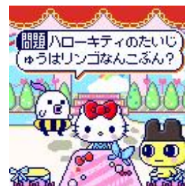
サンリオキャラクターに まつわるクイズゲーム