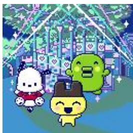
パレードが楽しめる 「ピューロランド」

本体のプレイ中、キャラクターがお出かけできる先として、「マリーランド」「ほしのせかい」「ピューロランド」のほか、いちごの王さまが住む「いちごおうこく」が新たに登場します。サンリオキャラクターにまつわるクイズが出題されるミニゲームや、キャラクターをモチーフにしたアイテムなど、サンリオキャラクターの世界観を存分に楽しめる要素が盛り込まれています。