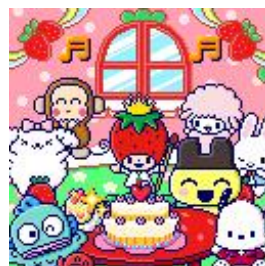
いちごの王さまと楽しく いちごパーティー