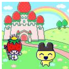
いちごの王さまが住む 「いちごおうこく」