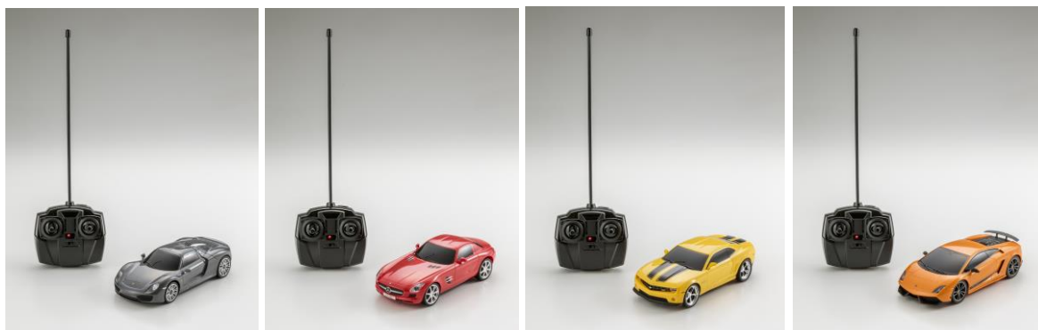
ポルシェ 918 スパイダー