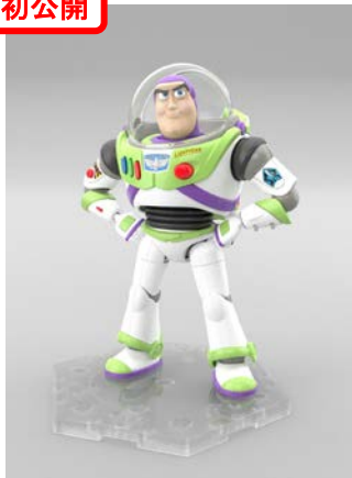
【トイ・ストーリー4】 トイ・ストーリー4 バズ・ライトイヤー 3,672 円・税 8%込、7 月発売予定 ©Disney/Pixar