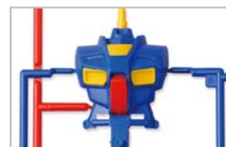
カラー多重インサート成形

1990年7月 MSジョイント、カラー多重インサート成形(同素材による1パーツ内での色再現)、4色イロプラと、当時の最新成形技術を1つの商品に集結した多色成形技術「システムインジェクション」を取り入れた「HGシリーズ」を導入し、「HG RX-78 ガンダム」など3種類を発売