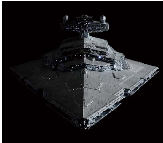
【スター・ウォーズ】 1/5000 スター・デストロイヤー ライティングモデル 初回生産限定版 12,960 円・税 8%込、8 月発売予定 ©&™ Lucasfilm Ltd.