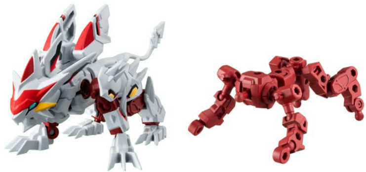
▲(左)『アニマギア』の「ガレオストライカー」 (右)骨格パーツの「ボーンフレーム」(ガレオストライカー)