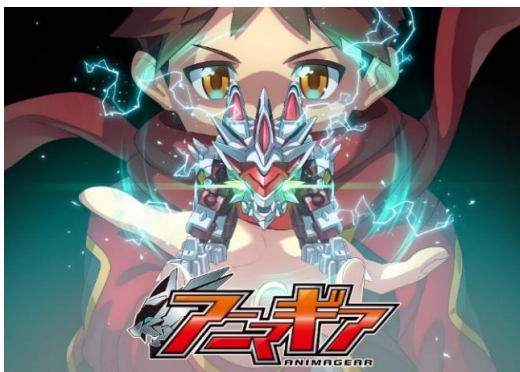
▲新 IP「アニマギア」のキービジュアル

株式会社バンダイ(代表取締役社長:川口勝、本社:東京都台東区)は、動物などの生物をモチーフにした手の平サイズのロボットがバトルを繰り広げる新 IP「アニマギア」の詳細情報を 2019年5月15日(水)に解禁し、そのロボットを組み立てられる食玩の新シリーズ『アニマギア』(第1弾 全5種、各421円・税8%込/各390円・税抜)を全国のスーパー・コンビニエンスストアなどのお菓子売場で 2019年8月より順次発売します。関節を動かすことができる骨格パーツにより、自由自在なポージングが可能のほか、装甲パーツを組み合わせることでカスタマイズを楽しめる点が特長です。