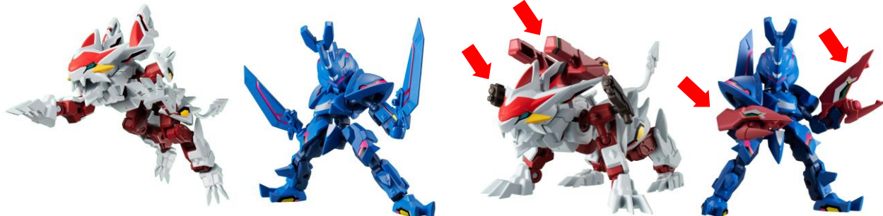
▲骨格パーツにより自由自在なポージングが可能