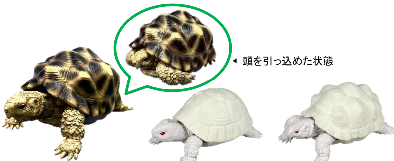
▲インドホシガメ/ギリシャリクガメ(アルビノ)/インドホシガメ(アルビノ)