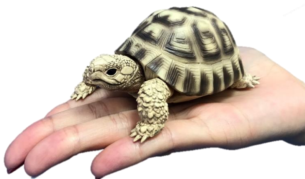
▲ギリシャリクガメ

人気のカプセルトイ『だんごむし』シリーズの開発担当が、近年、男性だけではなく女性の間でも爬虫類の人気が高まっていることに注目し、新たに『かめ』のカプセルトイを手掛けました。本商品は『だんごむし』シリーズと同様、自販機から甲羅に手足が収納され、丸まった状態のカメが転がり出るカプセルレス仕様です。全長10cmの手乗りサイズで、カメの骨格構造を徹底研究し、見た目のリアリティのみならず、首の骨格がS字状になり、頭を引っ込める動きなど、実際のカメの動作を再現するギミックを搭載しました。ラインアップは、愛好家も多い「ギリシャリクガメ」、ボコボコとした甲羅が特徴的な「インドホシガメ」と、真っ白なアルビノバージョン(各種)の全4種です。なお、本商品は2019年6月13日(木)~16日(日)に東京ビッグサイトで開催される「東京おもちゃショー2019」(13・14日は商談見本市:バイヤーズデー、15・16日は一般公開:パブリックデー)のバンダイブースにて展示します。