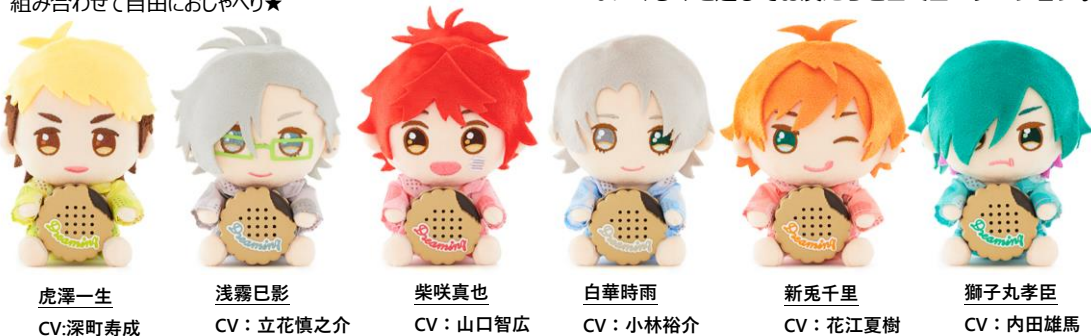
虎澤一生 CV:深町寿成