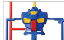
カラー多重インサート成形

1990年3月 MSジョイント、カラー多重インサート成形(同素材による1パーツ内での色再現)、4色イロプラと、当時の最新成形技術を1つの商品に集結した多色成形技術「システムインジェクション」を取り入れた「HGシリーズ」を導入し、「HG RX-78 ガンダム」など4種類を発売