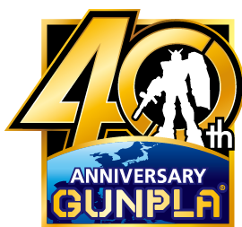
「ガンプラ40周年」ロゴ

本プロジェクトのキーワードは、“LINK”です。LINKをキーワードとして、40周年の集大成となる商品の発売、ガンプラの製作体験、大型イベントなどの実施、映像制作にともなうメディアミックス、さまざまなコラボレーションなどを展開し、「ガンプラ」を盛り上げていきます。