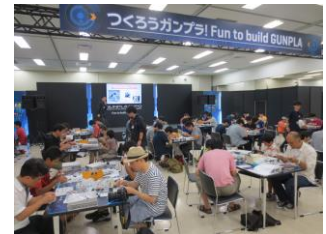
コミュニケーションイメージ

当時のガンプラブームの思い出、親子でのガンプラコミュニケーションなど、ガンプラを通じて人と人がつながり、そのつながりが 40 年間ガンプラを支えてくれています。ガンプラが友人、仲間、同僚、親子などをつなぐきっかけとなり、“楽しみ”の輪をつなげ広げていきたいという思いから、ガンプラプレゼント企画を行います。