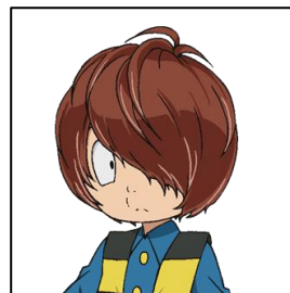
▲今後も「キュアグレース」や「鬼太郎」が登場予定