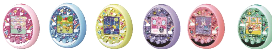
『たまごっちみーつ』 全 6 種、オープン価格、発売中

携帯型育成玩具「たまごっち」は、1996 年 11 月 23 日に発売しました。発売から約 2 年半で、全世界にて累計約 4,000 万個を販売し、社会現象となるほどのブームで大ヒット商品となりました。1996 年からこれまでに累計 8,200 万個以上を販売しています(2020 年 3 月末時点)。現在では玩具だけでなく、キャラクターとしての人気も定着しています。また、「たまごっち」シリーズの最新機種である『たまごっちみーつ』は、「たまごっち」本来の“育成の楽しさ”を追求し、ユーザー同士のコミュニケーションを拡大する機能を付加した商品です。本体内で育てたたまごっちを結婚させると、親の遺伝子を引き継いだたまごっちが生まれ、育てることができます。また、「たまごっち」シリーズ初となる Bluetooth®の搭載により、スマートフォンやタブレット端末を通じて全国のユーザーと遊ぶことができるなど、時代とともに進化を遂げています。