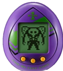
▲試験初号機モデル

株式会社バンダイ(代表取締役社長:川口勝、本社:東京都台東区)は、携帯型育成玩具「たまごっち」シリーズより、人気アニメシリーズ「エヴァンゲリオン」に登場する「使徒」の育成が楽しめる『汎用卵型決戦兵器 エヴァっち』(全3柄、各2,530円・税10%込/各2,300円・税抜)を2020年6月13日(土)に発売します。主なターゲットは20~30代の男女で、主な販売ルートは全国の玩具店、百貨店・家電・量販店の玩具売場、インターネット通販などです。なお、バンダイ公式ショッピングサイト「プレミアムバンダイ」、および一部のインターネット通販サイトでは4月15日(水)10:00より予約受付を開始します*。 *詳細は商品詳細ページよりご確認ください。(次頁記載)