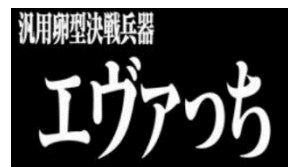
▲告知動画キャプチャ