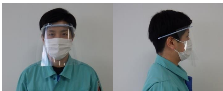
▲着用イメージ(正面・側面)