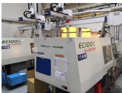
▲使用する射出成型機

要請を受けてから約2週間でフェイスシールドの金型を製作し、4月24日(金)から現在まで1万セットのフェイスシールドを生産しました。今後も1日3,000セットのペースで販売用マスクの生産を継続します。