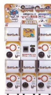
▲「スマートガシャポン」

2019年1月より稼働している「スマートガシャポン」は、キャッシュレス決済で商品を購入できるカプセル自販機です。Suicaなどの交通系電子マネーのほか二次元コード決済にも対応し、操作用タッチパネルおよび読み取り機1面と、商品販売機5面が1セットになっています。操作用タッチパネルでは、商品の購入方法を日本語、英語、中国語で表示することが可能で、外国人のお客さまも購入しやすい仕様です。また、設定によって商品購入後、タッチパネル上で抽選ゲームを表示するなど、商品購入時のエンターテインメント性を向上させる機能も有しております。