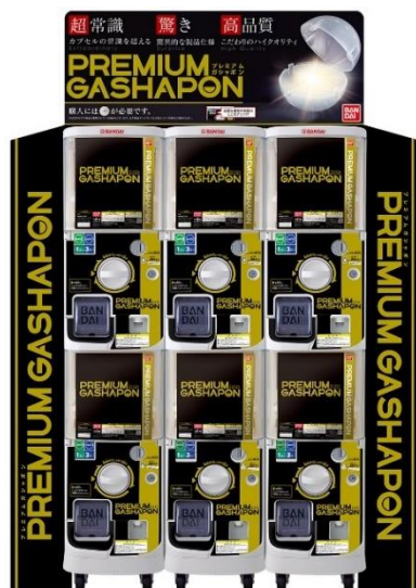
▲「プレミアムガシャポン」対応「ガシャポンステーション」

■ 30 秒でわかるプレミアムガシャポン動画: https://www.youtube.com/channel/UC2lvffCZhyY8Z5ZIKGIdwQ