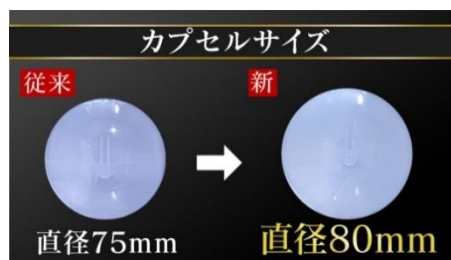
ポイント②: より大きなサイズの商品にも対応